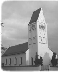
St. Margareta Hohenried