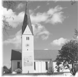
Mariä Reinigung & Hl. Wendelin Waidhofen