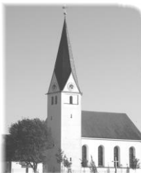
St. Michael Brunnen

Nr. 01/2018 Kirchenanzeiger vom 21.01.2018 – 25.02.2018