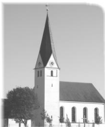
St. Michael Brunnen

Nr. 05/2017 Kirchenanzeiger vom 11.06.2017 – 09.07.2017