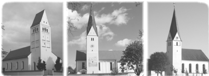
St. Margareta Hohenried