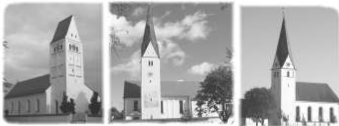
St. Margareta Hohenried