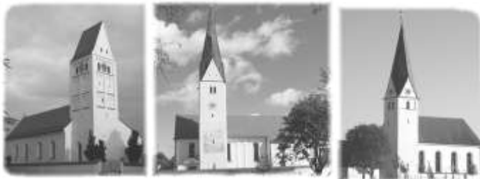
St. Margareta Hohenried