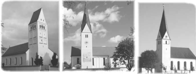
St. Margareta Hohenried